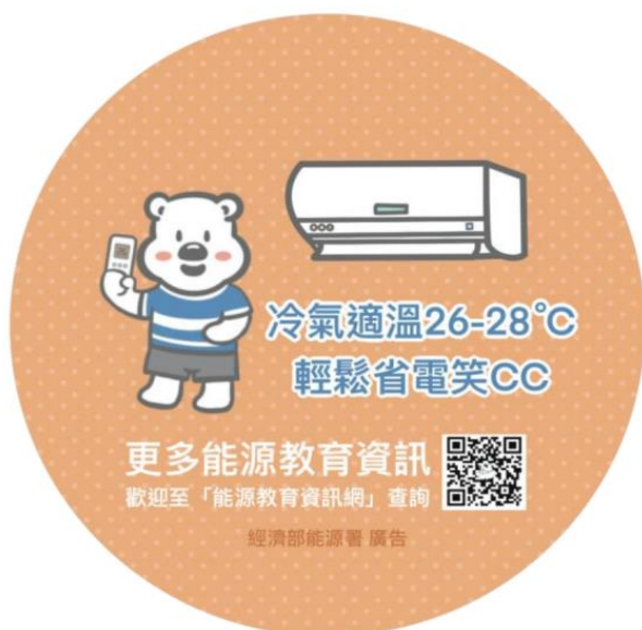
冷氣適溫26-28度C貼紙樣張

註:貼紙為冷氣適溫26-28°C及隨手關燈等2款，樣張如下，每款貼紙提供30張。