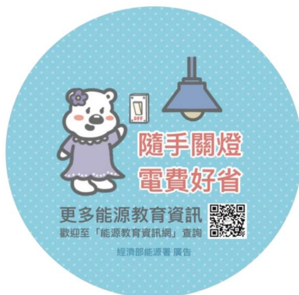
隨手關燈貼紙樣張