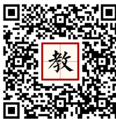
112 年活動教學模組指引連結