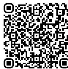
113 年活動教學模組指引連結