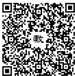
111 年活動教學模組指引連結

https://drive.google.com/file/d/1o9JGUfdYzQyv4L2Omy9GBTe4dA6D-CZE/view?usp=sharing