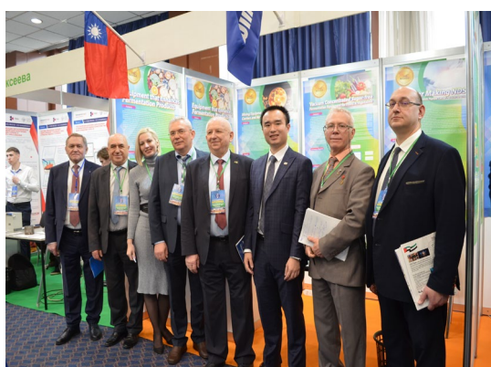
▲ 當地廠商蒞臨台灣展區洽談合作